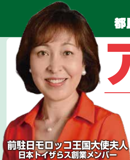
前駐日モロッコ王国大使夫人 日本トイザらス創業メンバー